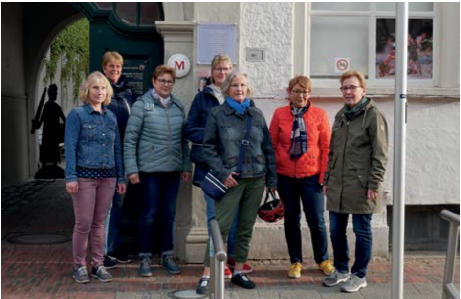
Das Historische Museum bildete den Abschluss der Radtour.